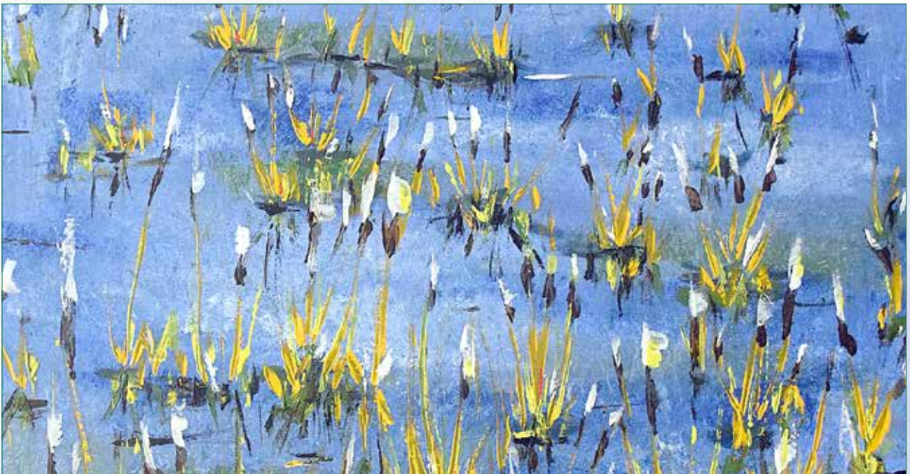
„Aus dem Wasser ragende Gräser in den Elbauen bei Hochwasser“ - Acryltechnik

ORIGINAL-APPELART – Arbeiten von Wolfgang Appell