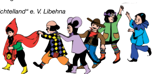
Kita „Wichtelland“ e. V. Libehna

Zur Verstärkung unseres Teams suchen wir zum nächstmöglichen Zeitpunkt in Vollzeit eine/n motivierte/n