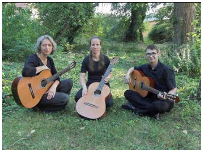
Gitarrentrio - Gitarrenkonzert