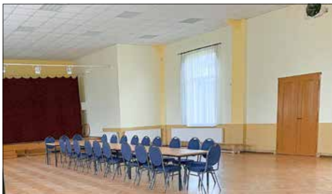
Saal mit Bühne

Saal mit Bühne: 88,00 € bis 90 Personen Gastraum: 20,00 € bis 10 Personen