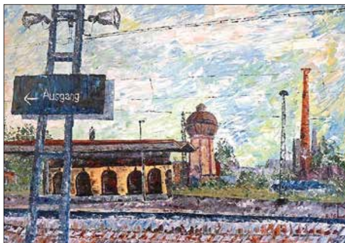
„Bahnhof Köthen“ von Stefan Luzius