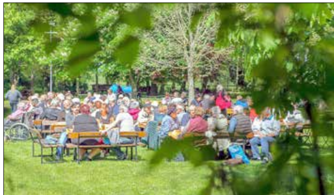
Die beliebte Kaffeestube auf Gut Möblitz öffnet 2020 mit dreimonatiger Verspätung ab 2. August für die Gäste in der grünen Oase des Gutsparkes ihre Pforten.

zu schleudern. Wem Süßes nicht so liegt, der kann sich im weiten Grün des Parks erholen und Entspannung suchen, aber auch kühle Getränke oder allerlei Herzhaftes genießen. Der Verein hat natürlich auch in Coronazeiten an fast Jedermann gedacht, damit die Sonntagnachmittage auf Gut Möblitz erlebnisreich und erholsam werden und eine Woche entspannt ausklingen kann. Wenn es das Wetter nicht so gut meint, dann findet die Kaffeestube im Kuhstall (Kulturscheune) statt. Ein Besuch lohnt sich auch 2020! Weitere Infos unter www.gut-moesslitz.de