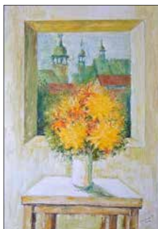
„Blumen zum Geburtstag“ von Friederike Prusky

Im Foyer des Sport- und Kulturzentrums ist eine Ausstellung mit Bildern von Mitgliedern des Malzirkels FK am Theater Köthen zu sehen. Es werden 26 Ölbilder gezeigt, die in den Jahren 2015 und 2017 entstanden sind. Zu sehen sind Landschaftsbilder, Blumen und Köthener Motive.