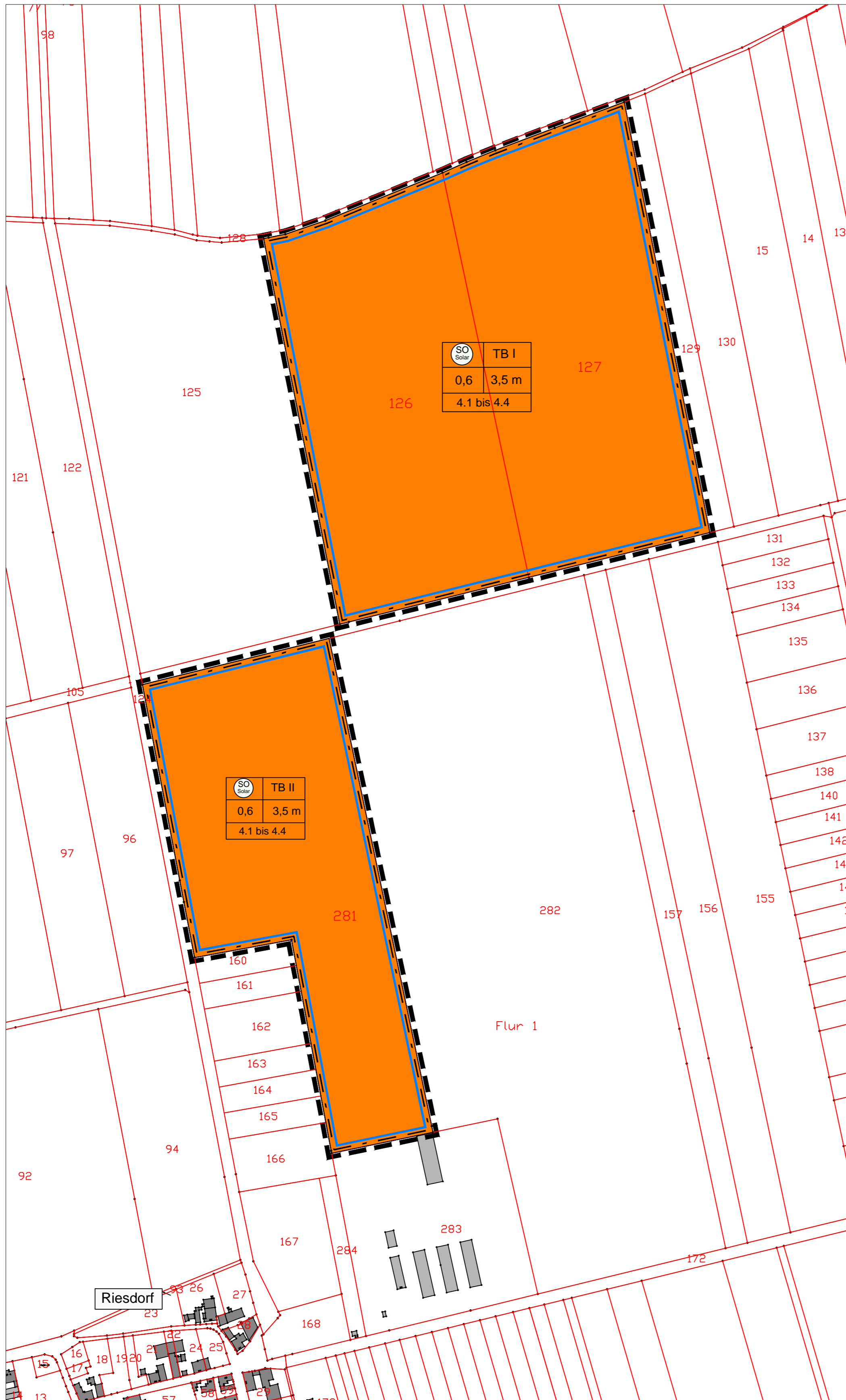
Übersichtskarte der Teilbereiche I und II